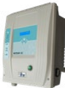
Coffret Meteor XC Meteor XC panel