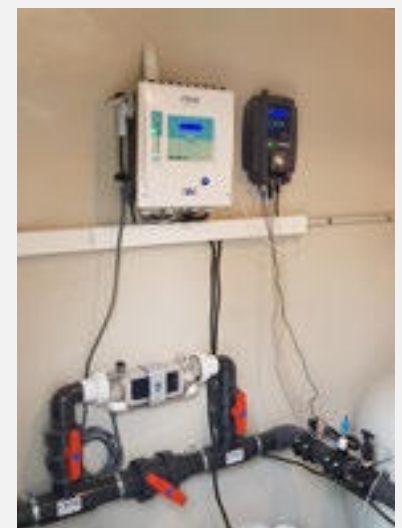
Meteor XC + Phileo PRO Credits : Atlas Piscine