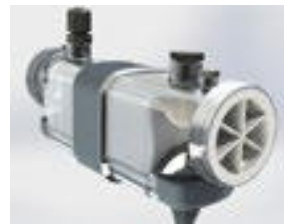
Cellule d'électrolyse avec sonde T°C et détecteur de débit Transparent cell with temperature probe and flow switch